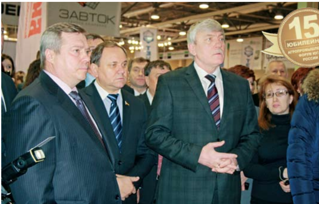
Торжественное открытие XV юбилейного агропромышленного форума